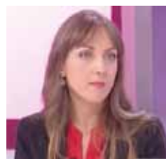
Colaboración en tv3 Oct. 2014 Tema: violencia filio-parental.

OBJETIVO: PROPORCIONAR A LAS PERSONAS PARTICIPANTES CLAVES, ESTRATEGIAS Y TÉCNICAS PARA ANALIZAR Y REFLEXIONAR EN AQUELLOS CASOS EN LOS QUE ESTÁ INTERVIENENDO.